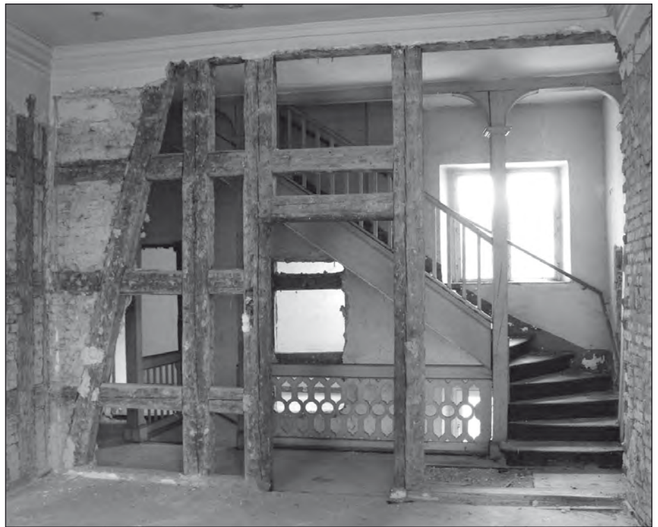
There is still a lot to be done! This is the house where Kaspar Hauser spent the last years of his life, and where he died three days after being stabbed. In the picture on page 6 you can see the architect's intentions.

Today it is difficult for many young people to find themselves and their true path in life. They have been traumatized by various circumstances and their search for meaning has been compromised. The Parzival Center in Karlsruhe, which