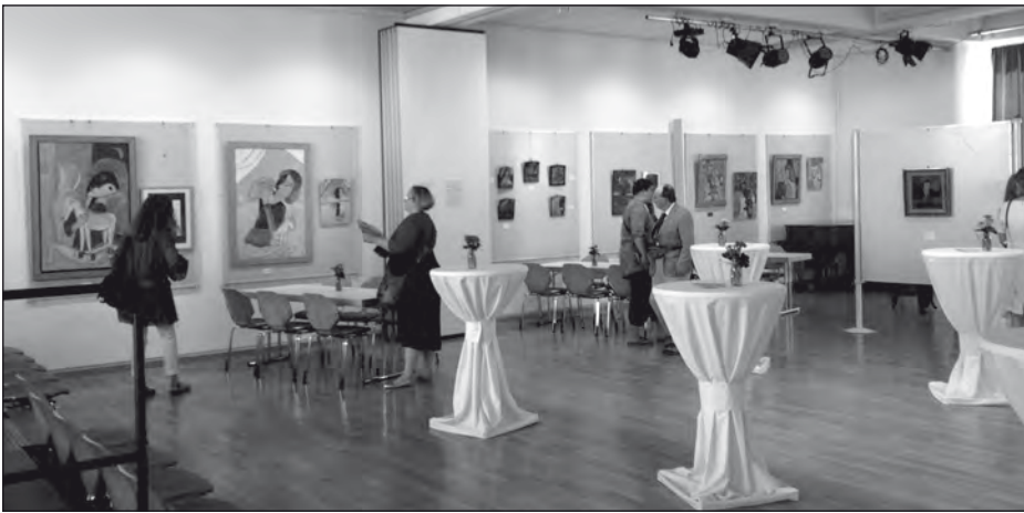
Ansbach, Kulturzentrum Karlsplatz: Ausstellung Greg Tricker / Exhibition Greg Tricker

be historically exact). Indeed, wouldn't all our lives be a single celebration, if people could recognize each other in their becoming?