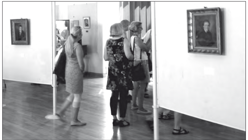
Anstehen zu Kaspar Hausers «Pferdchen». Links und rechts die beiden Porträts von Anselm Ritter von Feuerbach und Kaspar Hauser. / Queueing to see Kaspar's toy horse. To the left and right are original portraits of Anselm Ritter von Feuerbach and Kaspar Hauser.